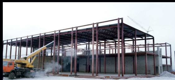
Изготовление и монтаж каркаса здания

Компания "Рязанский Металлист" - это подрядчик, который всегда выполняет взятые на себя обязательства. Мы предлагаем взаимовыгодные условия клиентам, разрабатываем КМД, рассчитываем материалы, организовываем доставку металлоконструкций до объекта.