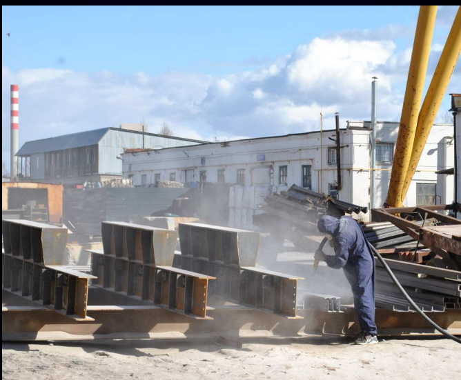
Пескоструйная очистка металлических балок