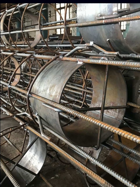
Каркас буронабивных свай